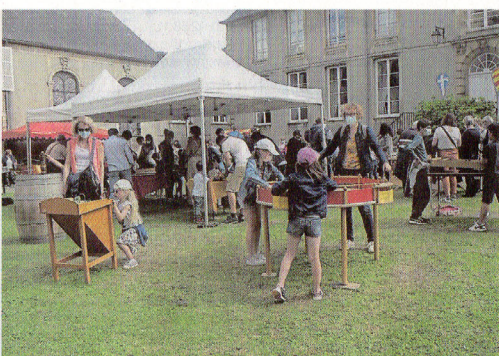
Petits et grands ont profité des jeux médiévaux installés dans la cour de l'Hôtel du Doyen pour patienter entre les spectacles