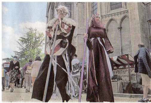
Il fallait penser à lever la tête pour observer toute la magie des Médiévales.