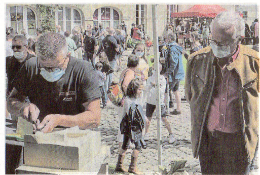
Les visiteurs étaient nombreux à venir découvrir le savoir-faire médiéval des artisans.