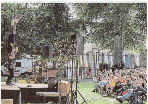
Le spectacle des Baladins de Méliador affichait complet ce dimanche, pour les Médiévales de Bayeux.