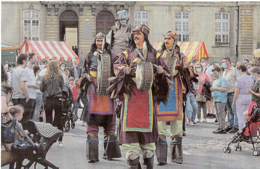
Sur un rythme de tambourins, les marcheurs de lumière déambulaient entre les stands de la cité bayeusaine

Près de 4 000 personnes ont assisté, samedi et dimanche, aux spectacles de la 34 e édition des Médiévales à Bayeux. Malgré une formule allégée, le public local a répondu présent.