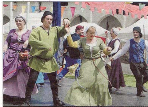
DANSE. Les arts médiévaux animent le marché tout au long du week-end.