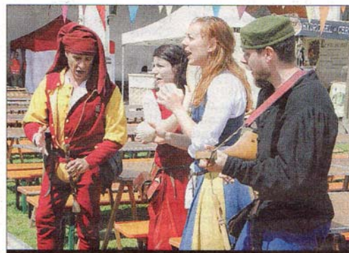
PARTAGE. En famille ou entre amis, il est possible de venir déjeuner ou dîner en profitant des spectacles.