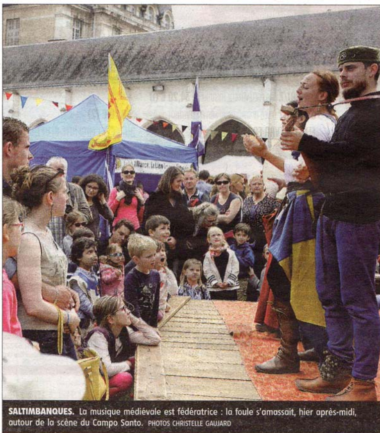
SALTIMBANQUES. La musique médiévale est fédératrice : la foule s'accumulait, hier après-midi, autour de la scène du Campo Santo.