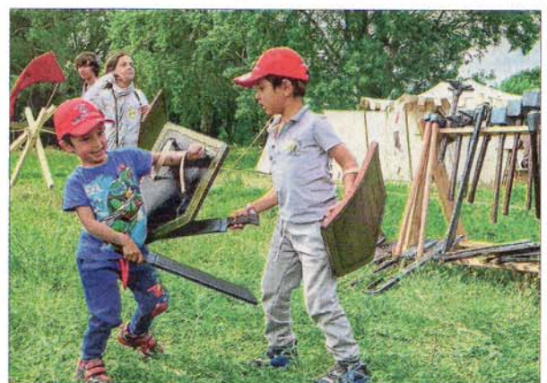
L'atelier d'initiation au combat pour tous les âges.