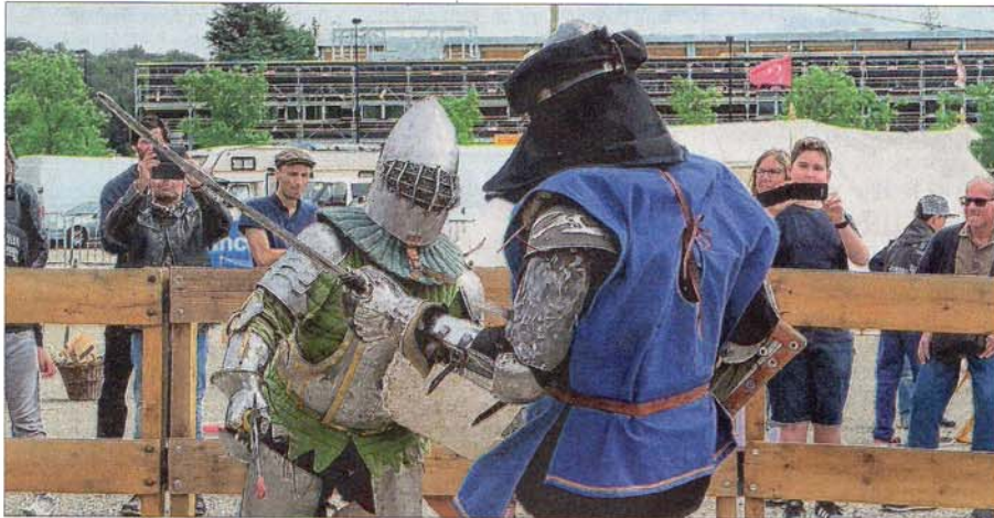
Hier, comme aujourd'hui, se déroule un tournoi de chevaliers avec des combats toutes les 30 minutes.

Plus d'animations pour attirer les familles. C'est le nouveau souffle qu'ont essayé d'impulser l'Association pour l'Histoire vivante et Le Royaume, les co-organisateurs du rassemblement médiéval "Le Prince d'Orange". Avec une vingtaine de compagnies venue de quinze pays à travers l'Europe (voir ci-contre), les animations étaient fournies. De la musique médiévale, des danses d'époque, du théâtre de rue, du maquillage pour les enfants, des initiations au combat avec des armes en latex et des tournois de chevaliers en armure prêts à croiser le fer toutes les 30 minutes permettaient aux plus jeunes comme aux plus âgés d'observer 1000 ans d'Histoire en toute distraction. Mais ce ne sont pas seulement les reconstitutions historiques, visibles à l'extérieur du parc des expositions et destinées au grand public, qui font la réputation de « l'un des plus grands rassemblements médiévaux du Sud de la France », dicit Christophe Dargère, le directeur de l'Association pour l'Histoire vivante. Ce qui fait le sel de cette manifestation qui attire chaque année environ 2000 visiteurs, c'est bien le marché de l'Histoire. Situé à l'intérieur du Parc