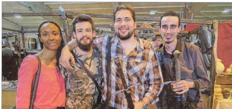
Ces amis, de la compagnie Chantelame, sont venus d'Isère pour s'équiper d'épées.