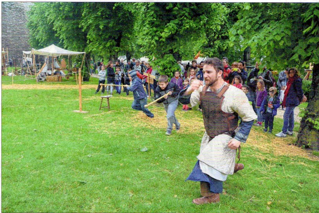
On peut se glisser dans la peau d'un chevalier !

tacles à ne pas rater, comme « L'éveil du dragon », ou encore le spectacle de dressage équestre « Elfika, la légende ».