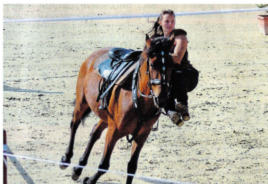
Deux cascadeurs équestres se sont succédé sous les applaudissements.