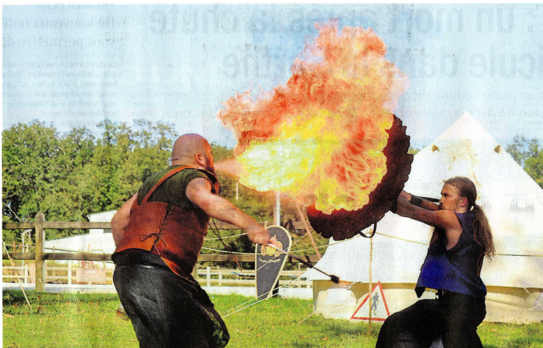
Yvré-l'Évêque, hier. Le Medieval throne se poursuit ce dimanche au Pôle européen du cheval.