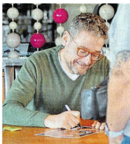
Les acteurs de Kaamelott Nicolas Gabion et Bô Gaultier de Kermaal seront encore présents aujourd'hui.