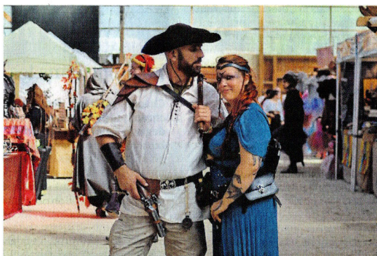
Les visiteurs n'ont pas hésité à se déguiser.