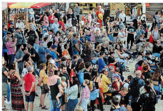
Le défilé des plus beaux costumes a rassemblé du monde.