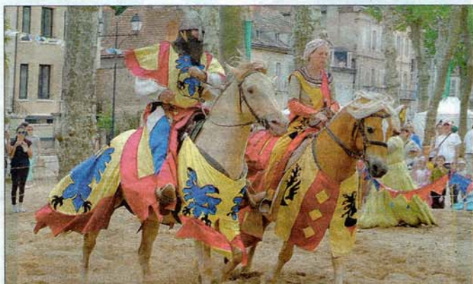
ANIMATIONS ÉQUESTRES. Pas de fête médiévale sans l'animal emblématique de cette période.