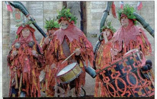
MUSIQUE. Les musiciens de Saboi ont arpenté les rues cussetoises.

Au terme d'une journée sans aucun nuage, l'orage est venu interrompre les Flamboyantes, hier. Mais les festivités reprennent ce dimanche, à partir de 10 h 30.