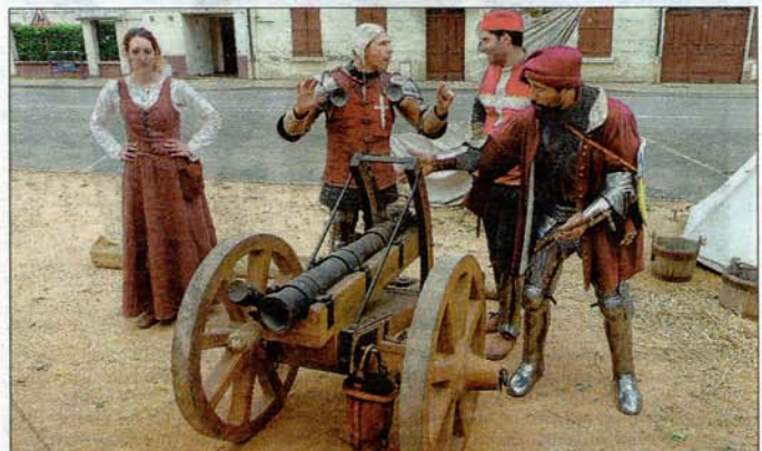
BOUTEZ LE FEU! Les machines de guerre sont au rendez-vous de cette seconde édition.