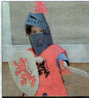
BOUH! C'est jour de fête pour les enfants.