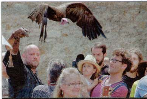
FAUCONNERIE. La compagnie Vol en Scène a présenté ses rapaces.