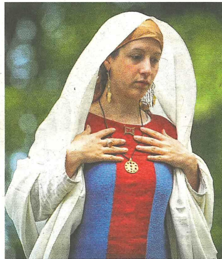
Un personnage de l'Empire carolingien défilant sur le podium de la place De-Gaulle.