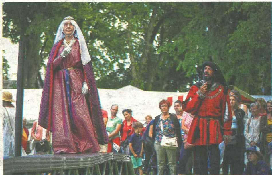
Une reine du XIII e siècle aux atours de soie brodée lors du défilé de mode.