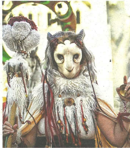
Les dresseurs de dahus chassant les mauvais esprits.