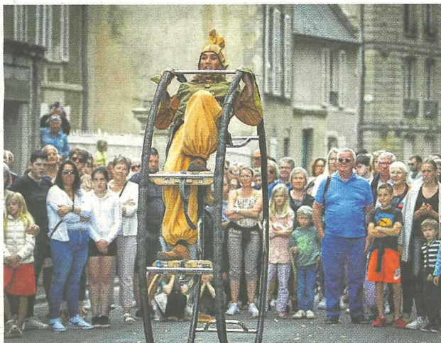
Fraîchement sortis de leur forêt d'Argonne, les Lutins ont un caractère bien affirmé. Leurs numéros de rue ont conquis les spectateurs.