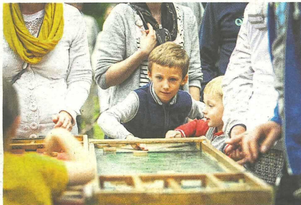
Le jeune public raffole toujours du jardin des jeux, installé non plus à l'Hôtel du Doyen, mais place De-Gaulle.