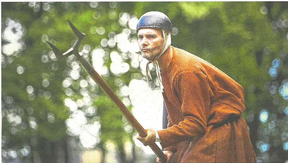
Un paysan armé pour la guerre, prêt à en découdre, avec une arme capable d'embrocher l'ennemi comme une vulgaire botte de paille.