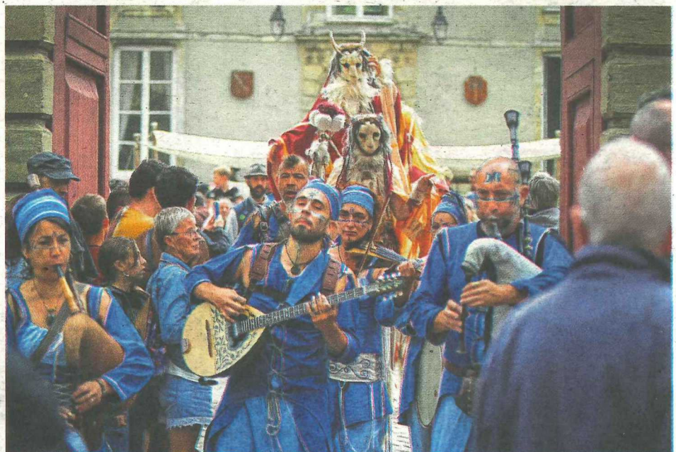
Trybu et les A-Cordés ouvrent la route en musique pour les mystiques dresseurs de dahus de la compagnie Dahutanes, qui s'inspire du folklore pastoral.