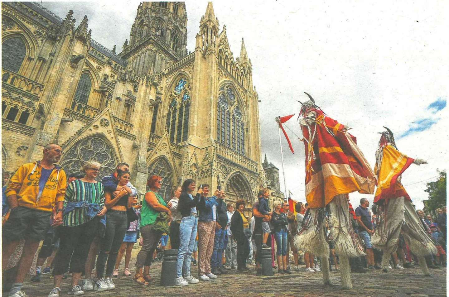
Edition record pour ces 35 e Médiévales de Bayeux qui ont renoué avec leur public. Les spectacles, tavernes et échoppes ont fait le plein.

« Nous sommes sur une année record à tous les niveaux. D'abord en termes de fréquentation. On estime que plus de 60 000 visiteurs étaient présents à Bayeux de vendredi à dimanche. Record aussi en termes de ventes sur les stands, soutenant au passage des artisans qui n'ont pas forcément bénéficié des mêmes aides que les commerçants après deux années difficiles pour eux. Record aussi