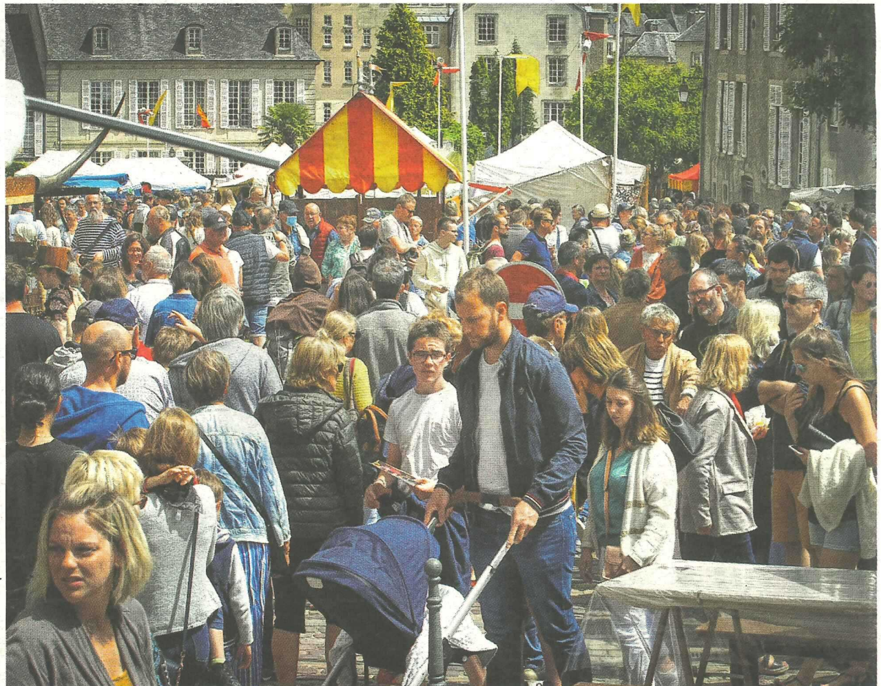
Les 35 e Médiévales de Bayeux ont accueilli plus de 60 000 visiteurs, confirmant leur statut de troisième événement du genre au niveau national.