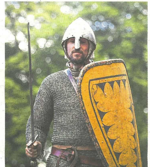
Un soldat normand de Dex Aïe, paré pour le combat.