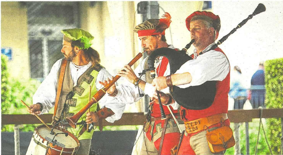
Musiciens du Royaume de la Vèze en Pays de Retz, entre Bretagne et Poitou, Smedelyn a offert un voyage musical et festif de plusieurs siècles.

accueillis du 1 er au 3 juillet 2022. Plus de 10 000 spectateurs, selon la Ville, ont assisté à la grande parade qui a donné, Médiévales ont sérieusement repris du poil de la bête !